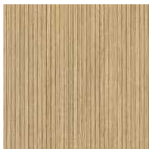
laminovaná DTD tl. 25 mm, dekor: dekor Dub Highline, H3344 SM