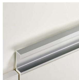
úchytky z eloxovaného hliníku, narážecí, v. 26 mm, š. 19 mm, na délku dvířek