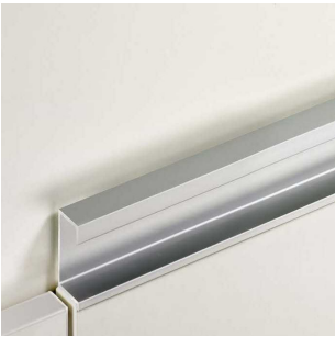
úchytka z eloxovaného hliníku, narážecí, v. 26 mm, š. 19 mm, na délku dvířek

POZNÁMKA: Rozměry veškerých prvků s vazbou na stavební konstrukce je třeba před realizací ověřit na stavbě ! Dokumentace je v podrobnosti pro výběr zhotovitele, nejedná se o výrobní dokumentaci ! Zhotovitel předloží výrobní dokumentaci a vzorky materiálů před zahájením prací ke schválení.