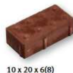
Obr. 1 a 2 Betonová zámková dlažba s výstupky pravidelného tvaru a betonová dlažba s drážkou